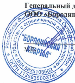
Генеральный директор ООО «Бородинский квартал»